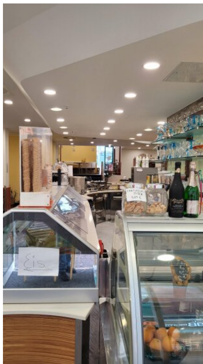
Eiscafe Blick vom Eingang