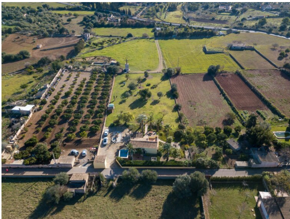
Grundstück mit Aussicht