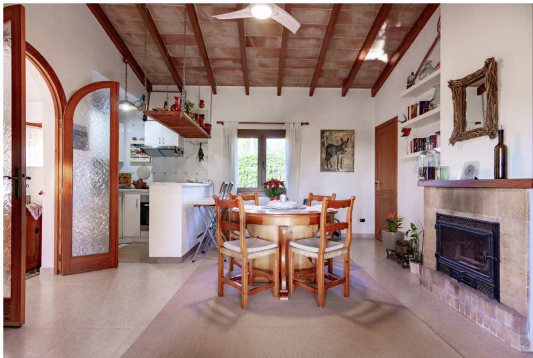
Küche und Essbereich