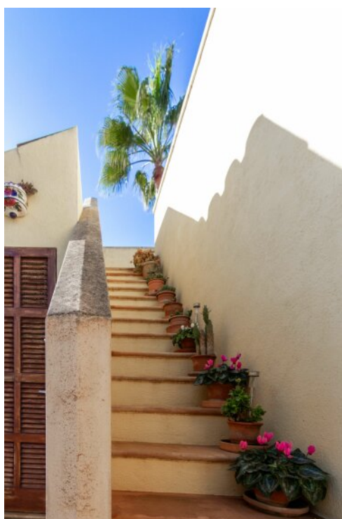
Treppe zur Sonnenterrasse