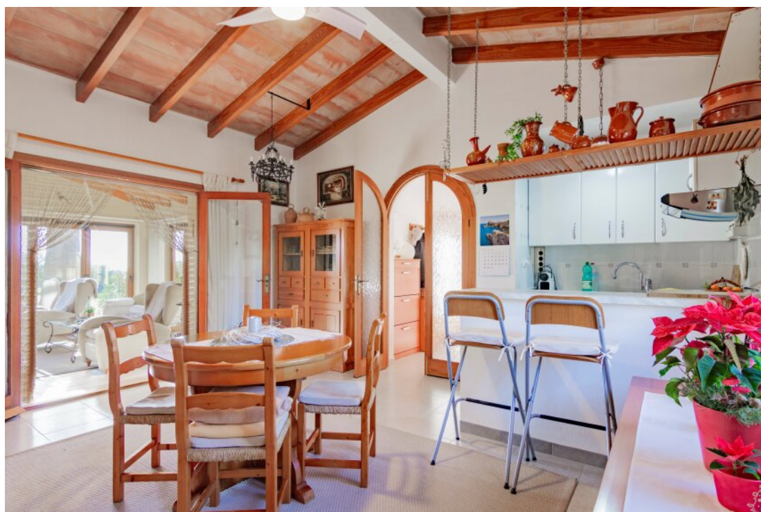
Küche und Essbereich